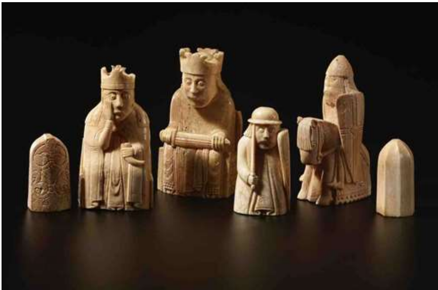
Jeu d'échecs de Lewis, ivoire, 1150-1175, probablement réalisé par les Vikings, découvert en Ecosse

Dimanche 22 avril : le British Museum à Valenciennes