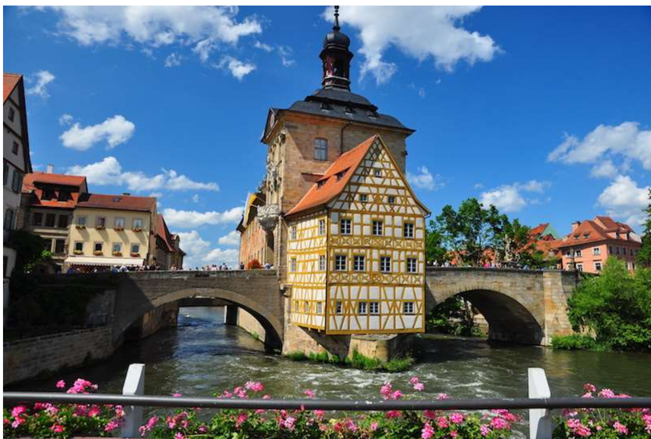
Bamberg. La Bavière, du 14 au 18 mai

Vauban Loisirs Animation Culture - 199 rue Colbert - 59000 LILLE Centre Vauban - Entrée Douai - 4 ème étage